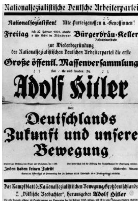
Das Plakat zur Versammlung in München, auf der Hitler die NSDAP „neu ins Leben“ rief.

Wir nahmen Kontakt mit den Experten im Münch-