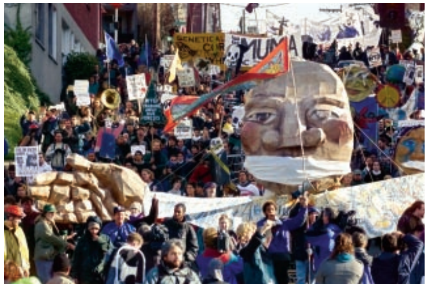
Seattle 1999: Friedlicher Protest gegen die WTO eint Umweltschützer, Gewerkschafter, Dritte-Welt-Aktivist:innen.

Für die WTO scheidet Seattle, die Mitglieder kommen auf keinen Konsens. Erstmals wehren sich die Vertreter der afrikanischen, lateinamerikanischen und karibischen Staaten gegen die Übermacht der Industrienationen, verweigern ihre Zustimmung zu den Abschlussdokumenten. Das Scheitern für die WTO ist ein Gewinn für die Zivilgesellschaft. Denn wie nie zuvor wird klar, welchen Einfluss die Welthandelsorganisation auf unsere Ernährung, den Umweltschutz, die Menschenrechte, auf Arbeitsplätze, den Umgang mit Entwicklungsländern und unsere demokratischen Entscheidungen hat.