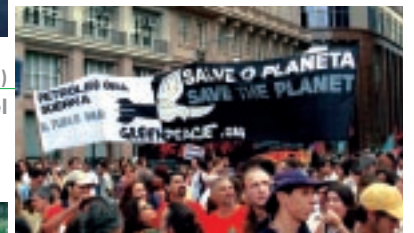
Juni 2003, Berlin Beim Globalisierungskongress McPlanet.com