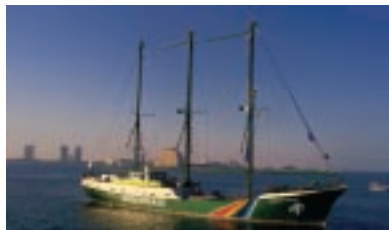
November 2001, Doha (Katar) Die Rainbow Warrior bei der 4. WTO-Ministerkonferenz