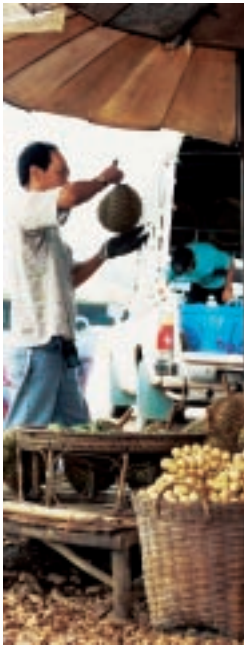
Die WTO fordert die Öffnung der Handelsschranken: Auf lokalen Märkten, hier in Thailand, können regionale Produkte nicht mehr mit subventionierten Einfuhren konkurrieren.

Angestrebtes Ziel der WTO ist der weltweite Abbau aller Handelsschranken. Zu dessen Verwirklichung bedient sich die machtvolle Organisation verschiedener Abkommen mit folgenden Grundsätzen: