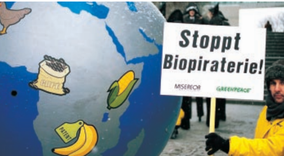
Die WTO fordert Patente, ermöglicht Biopiraterie – das EU Patentamt erteilt Patente auf Leben