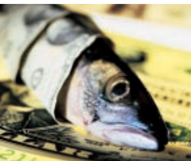
Wirtschaftliche Interessen oder Umweltschutz? Wen begünstigt die WTO?

Ende des Zweiten Weltkrieges bemühen sich die „Siegermächte“ um eine Neuordnung des internationalen Finanz-, Währungs- und Handelssystems: Zur Stabilisierung und Finanzierung des Wiederaufbaus kreieren sie die Weltbank und den internationalen Währungsfonds (IWF), zur Wiederankurbelung des Welthandels eine Internationale Handelsorganisation (ITO). Im März 1948 unterzeichnen 56 Länder in Havanna die ITO-Charta, doch der US-Kongress versagt seine Zustimmung. Die Idee einer Internationalen Handelsorganisation ist gescheitert. Von den geplanten ITO-Handelsbestimmungen bleibt unter dem Namen GATT (General Agreement on Tariffs and Trade: Allgemeines Zoll- und Handelsabkommen) nur ein Kapitel erhalten, der Aspekt des weltweiten Abbaus von Zöllen. Mehrere GATT-Verhandlungsrunden führen dazu, dass die Zölle durchschnittlich von ehemals 40 bis 50 Prozent (1948) auf 4 bis 5 Prozent (1994) sinken. Die Schlussakte der letzten GATT-Runde, der Vertrag von Marrakesch, wird 1994 als offizielle Geburtsurkunde der Welthandelsorganisation (WTO) angesehen. Mit diesem Dokument werden bis auf wenige Ausnahmen alle Bereiche des weltweiten Handels der neuen Organisation WTO unterstellt. Diese beginnt im Genfer Amtssitz des GATT-Sekretariats am 1. Januar 1995 als eigenständige Organisation außerhalb des UN-Systems ihre Arbeit. Ursprüngliches Anliegen der WTO ist, den internationalen Handel zwischen Staaten und Unternehmen zu lenken und zu erleichtern.