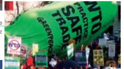
Dezember 1999, Seattle 3. WTO- Ministerkonferenz