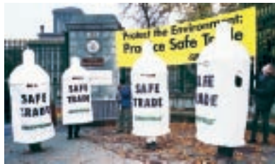
Oktober 1999, Genf Vor dem WTO-Sitz

Haben zu Zeiten des GATT die stärksten Industrienationen noch frei über den Welthandel bestimmt, wächst in den letzten Jahren der Widerstand: NGOs und Entwicklungsländer mobilisieren gemeinsam gegen eine ungerechte WTO-Politik, die immer wieder die reichen Nationen bevorzugt, während Menschenrechte und Umweltschutz auf der Strecke bleiben. Auch Greenpeace protestiert seit 1999 gegen Auswüchse des Freihandels: