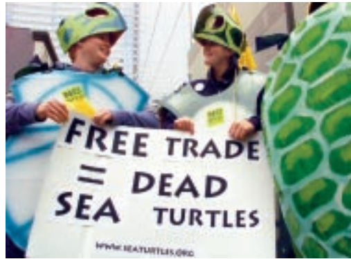
Freier Handel contra Schutz bedrohter Meeresschildkröten.

Und dann kommt Seattle! Im US-Bundesstaat Washington formiert sich 1999 erstmals während einer WTO-Ministerkonferenz massiver Protest: unter anderem gegen die Aufnahme neuer Themen in die WTO und gegen deren undemokratische Entscheidungsstrukturen. Bauernorganisationen aus verschiedenen Teilen der Welt sehen ihre Landwirtschaft durch das Agrarabkommen der WTO bedroht und fordern, „Landwirtschaft raus aus der WTO“. Umweltschützer beteiligen sich, als Meeresschildkröten verkleidet, denn die WTO hatte in einem Streitfall dem freien Handel Vorrang vor dem Schutz der bedrohten Meeresschildkröten gegeben. Entwicklungspolitische Gruppen fordern den fairen statt den freien