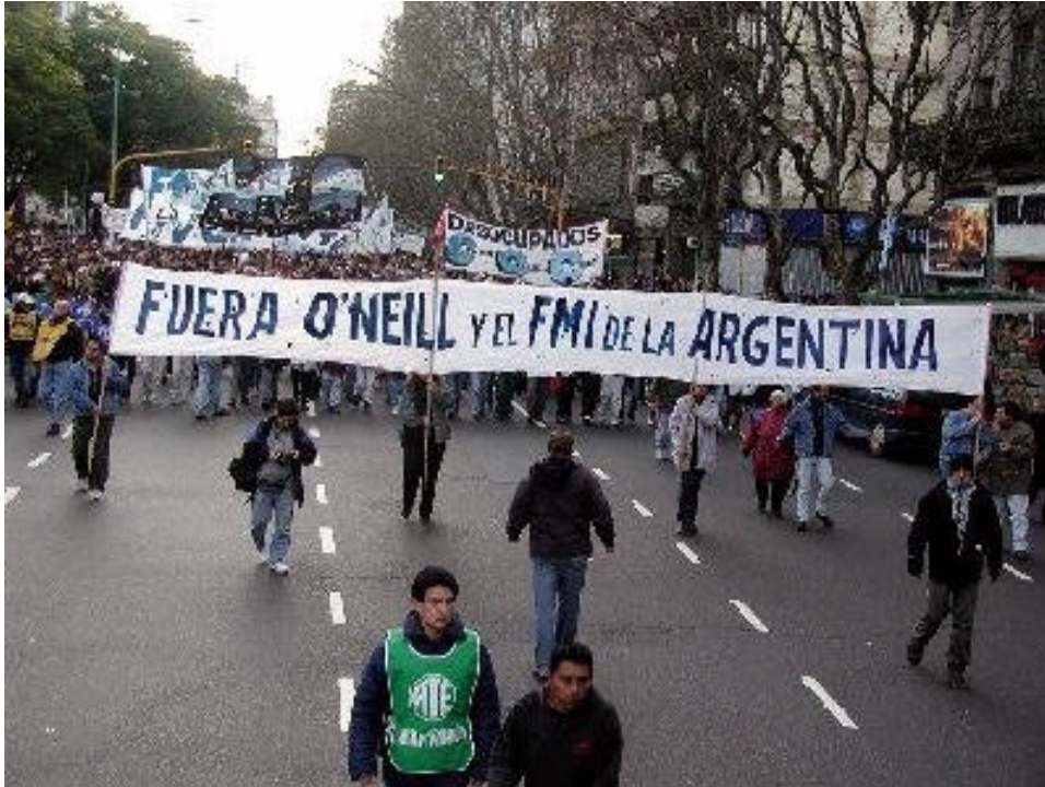
„IWF und O'Neill raus aus Argentinien“: Widerstand gegen die Einflussnahme von Fonds und US-Finanzministerium