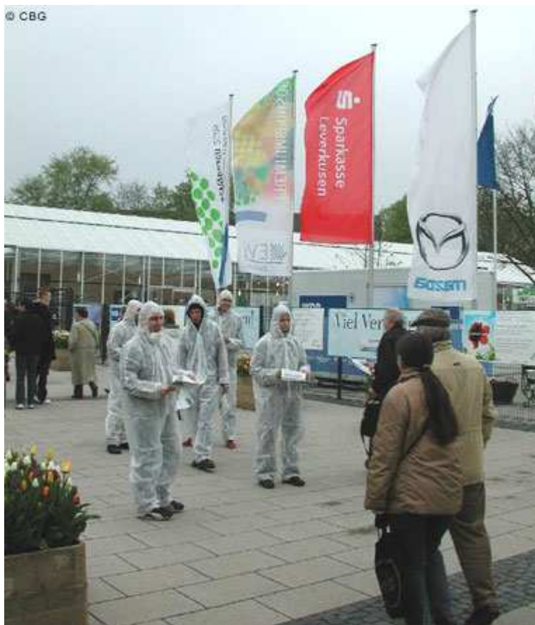
Gartenschau-Eröffnung in der Dhünnaue

In der Kritik steht immer noch die Landesgartenschau in der Leverkusener Dhünnaue. Dort hatte das angrenzende BAYER-Werk jahrzehntelang giftige Chemikalien entsorgt und mangelhaft gesichert. Durch sie, so die CBG zur von BAYER gesponsorten Gartenschau-Eröffnung im April, solle "vergessen gemacht werden, dass der BAYER-Konzern über Jahrzehnte hinweg die Gefahren der Dhünnaue - der größten bewohnten Giftmülldeponie Europas - verharmlost hat. Die Deponie vergiftete das Grundwasser und schädigte die Gesundheit zahlreicher Anwohner."