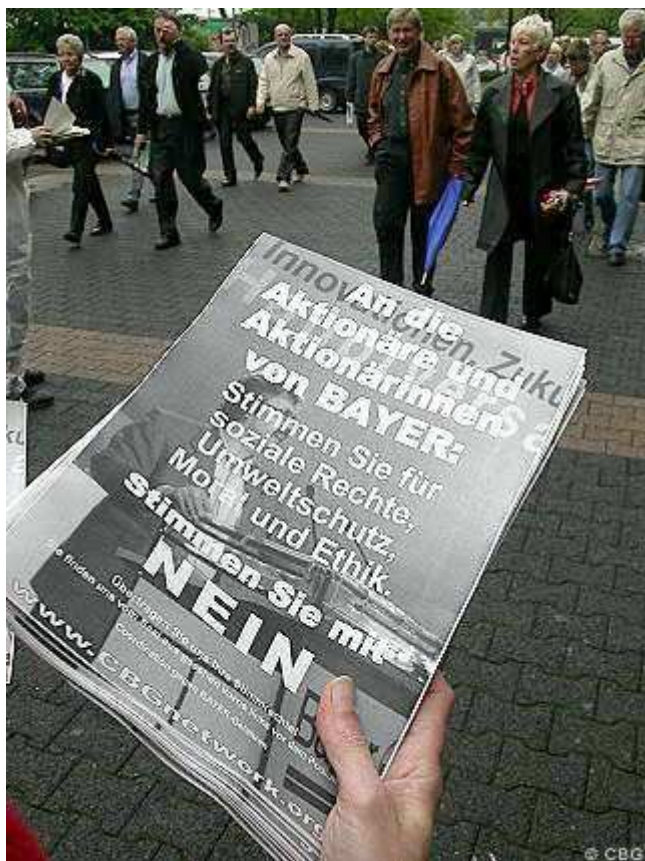
CBG-Informationen für BAYER-Aktionäre